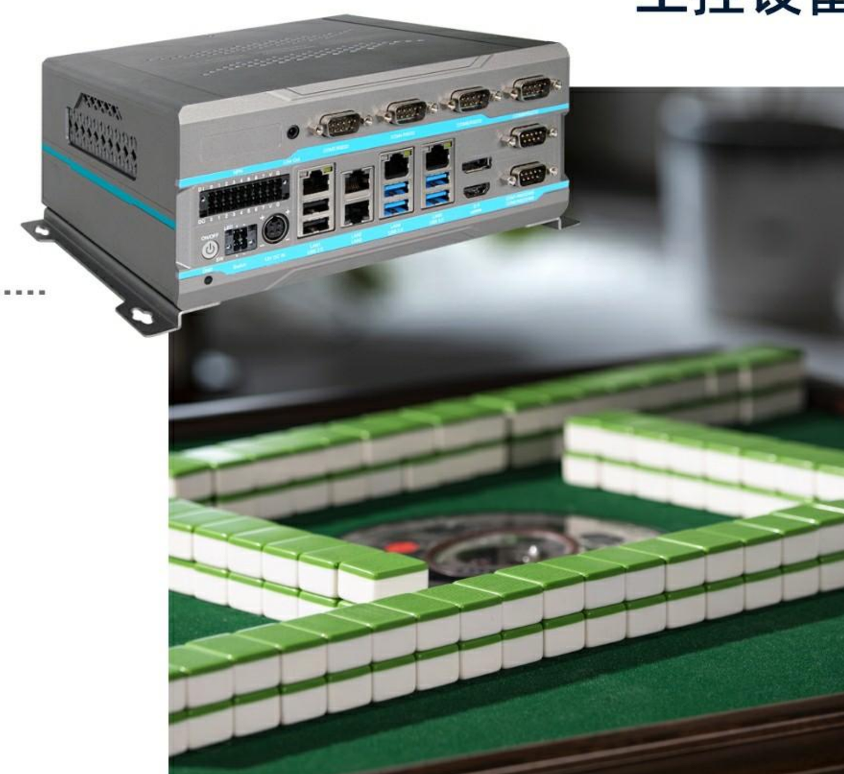
智能电器 工控设备