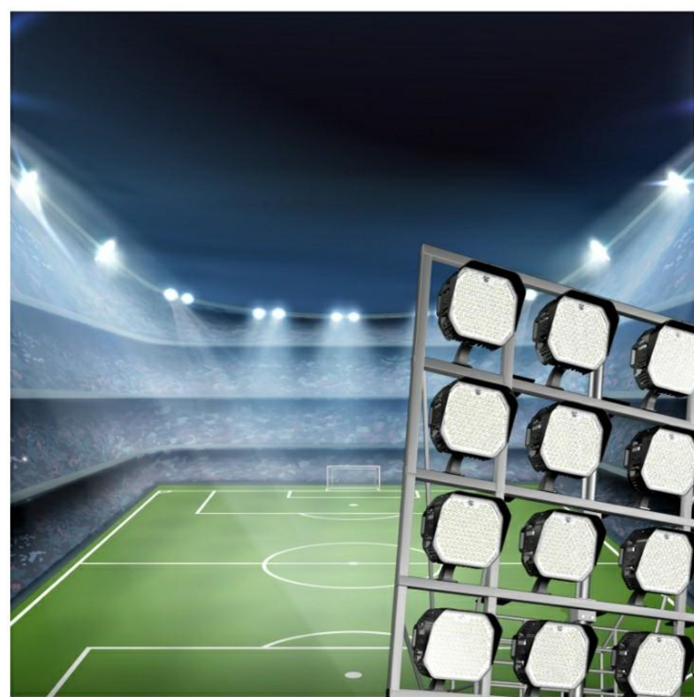
球场塔吊 灯光照明