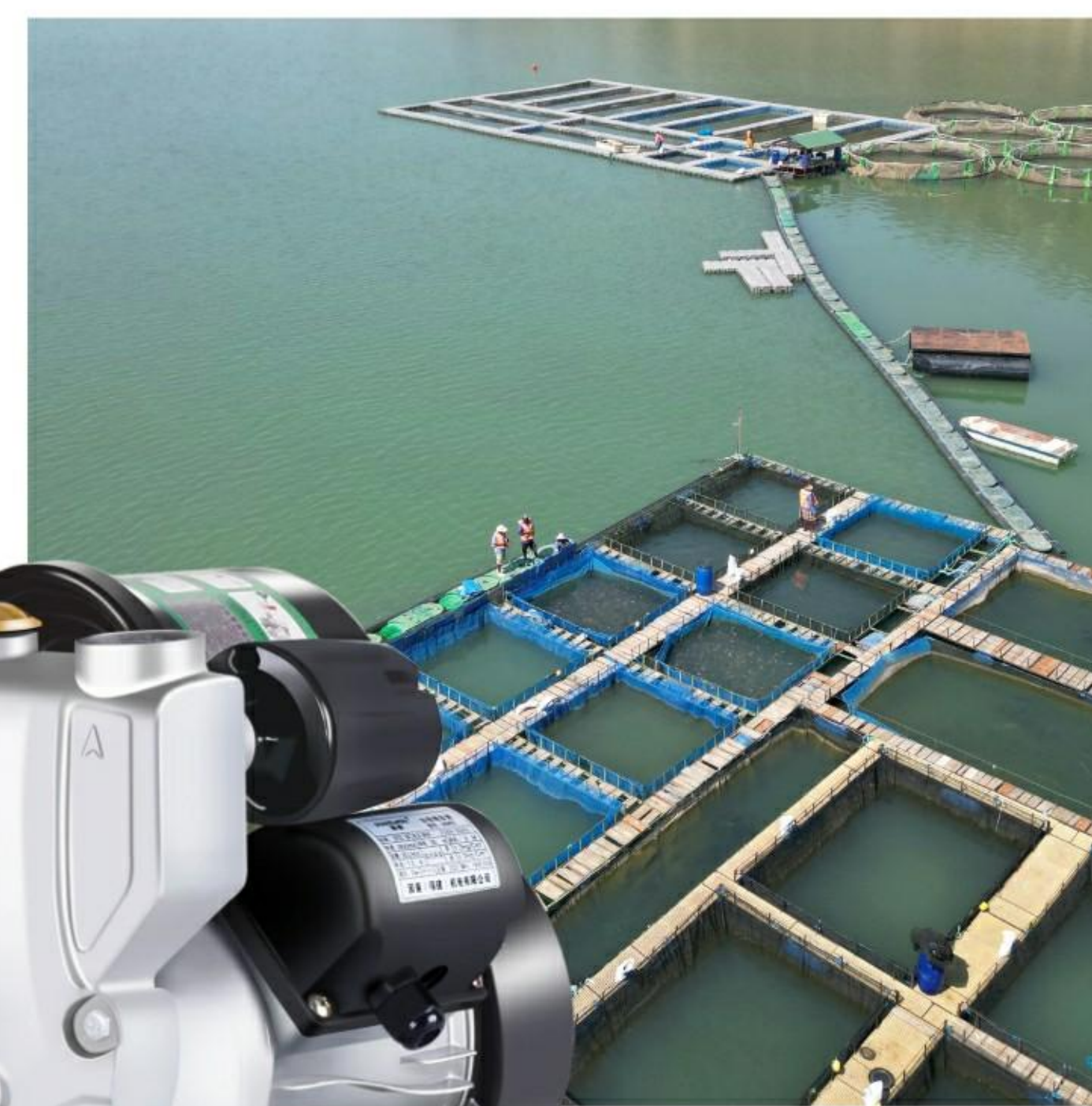
水阀水泵 电机马达