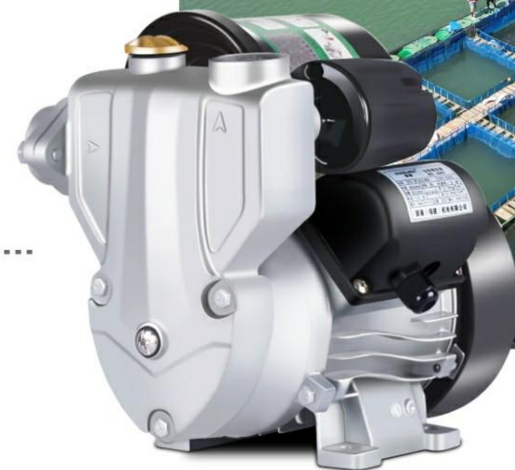
水阀水泵 电机马达