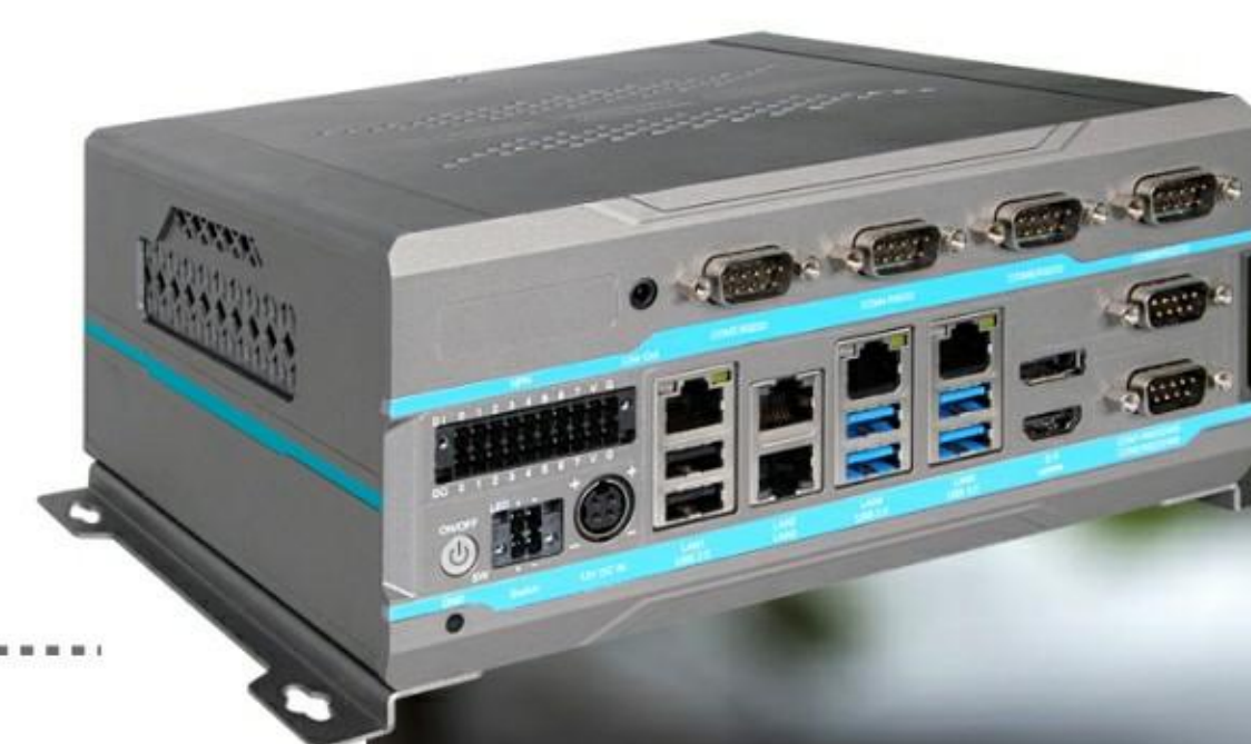
智能电器 工控设备