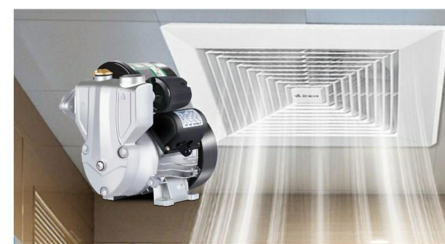
电机/水泵/排风换气